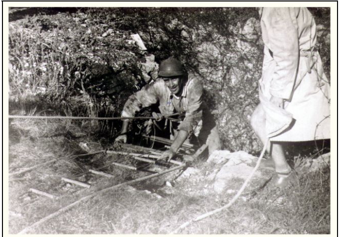
La Squadra Esplorazione Foibe esplora il pozzo di Basovizza