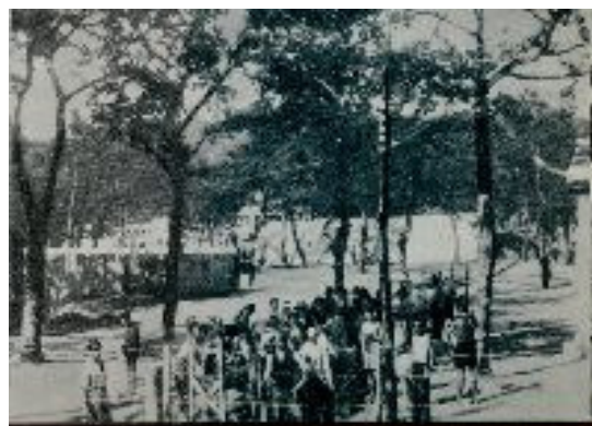
Immagine del campo di Renicci (presso Anghiari, AR), il più grande lager costruito in Italia per ospitare i civili jugoslavi rastrellati dalle truppe italiane in Slovenia