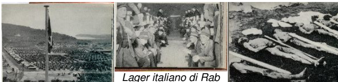
Lager italiano di Rab